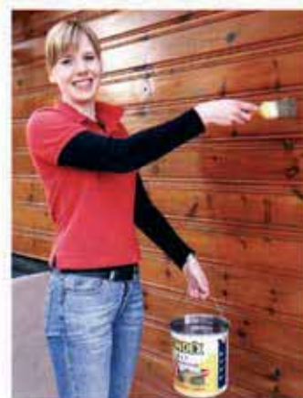
Die Bondex Imprägnier-Lasur 2-in-1 ist Imprägnierung und Lasur zugleich.

Holz im Außenbereich muss den Einflüssen von Sonne, Wind, Regen und anderen holzschädigenden Einflüssen standhalten. Besonders bei Nadelhölzern, wie Kiefer oder Fichte, reicht ein einfacher Lasuranstrich jedoch nicht aus. Um das Holz vorbeugend zu behandeln, ist eine vorherige Imprägnierung notwendig. Ein hoher Arbeitsaufwand, der sich vermeiden lässt. Die Bondex Imprägnier-Lasur 2-in-1 ist Imprägnierung und Lasur zugleich. Damit spart sich der Heimwerker nach Aussage des Unternehmens aufwendiges Mehrfachstreichen mit Vor-, Zwischen- und Endbeschichtung. Während der Anstrich