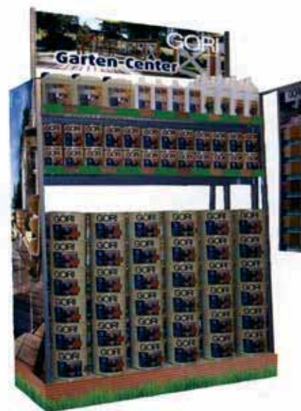
Das Gori Garten-Center von Dyrup.

Jorkisch vermarktet das Premium-Thermoholz von Firstwood® exklusiv an den Holz- und Baustoffhandel. Denen soll das neue