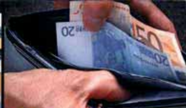
Falschgeld ... Kontrolle ist besser