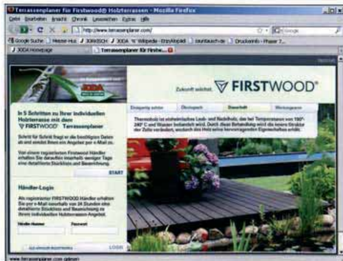
Die Startseite des Terrassenplaners.