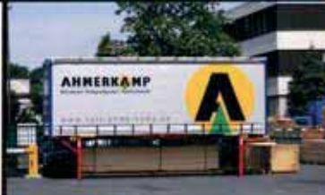
Ahmerkamp Neu in Langenhagen