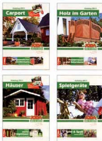
Die aktuellen Joda® Kataloge 2011