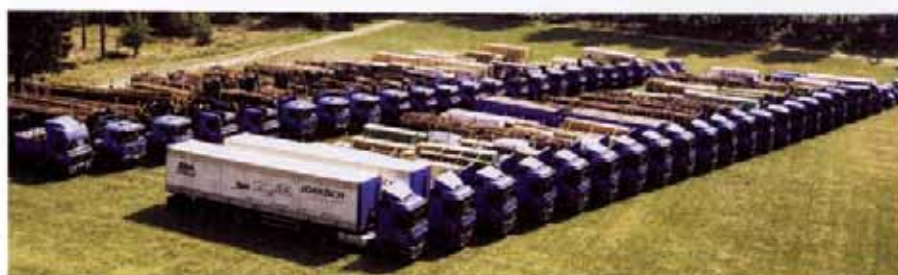
Firmenzentrale Daldorf an der A21 mit dem Jorkisch-Fuhrpark